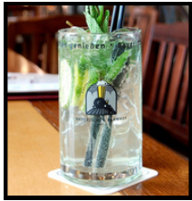
0,5 l – 4,90 €

„Herbert“ – unsere hausgemachte Limo mit selbstgemachtem Hopfensirup. Erfrischend anders.